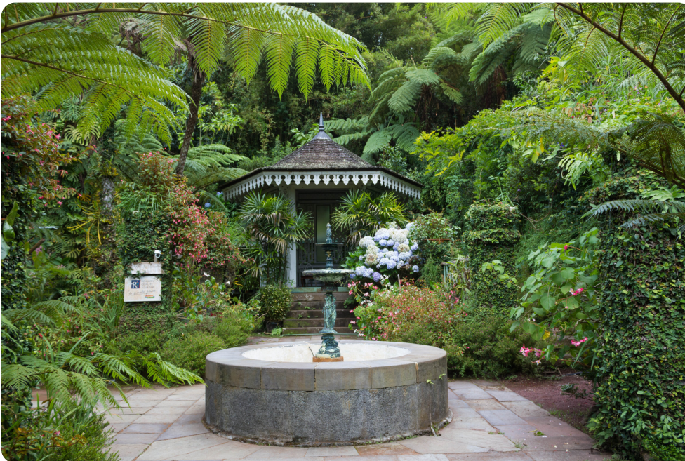
Am frühen Morgen brechen

in Richtung des Talkessels Salazie, bekannt für seine beeindruckenden Wasserfälle und die üppige Vegetation. Ein Halt in Saint-André lohnt sich, um den tamilischen Tempel „Le Colosse“ und die Vanilleplantage von Roulof zu besichtigen. Anschließend erreichen Sie Hell-Bourg, ein charmantes kreolisches Dorf. Hier sollten Sie unbedingt die Maison Folio und das Museum der Musik und Instrumente des Indischen Ozeans besichtigen.