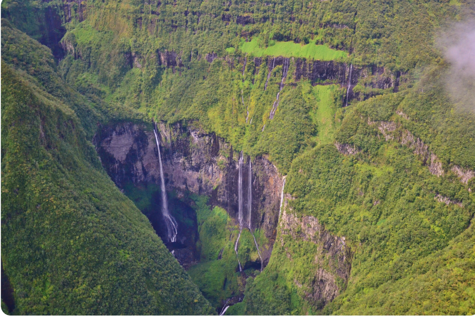
Abfahrt entlang der Ostküste

in Richtung des Talkessels Salazie, bekannt für seine beeindruckenden Wasserfälle und die üppige Vegetation. Ein Halt in Saint-André lohnt sich, um den tamilischen Tempel „Le Colosse“ und die Vanilleplantage von Roulof zu besichtigen. Anschließend erreichen Sie Hell-Bourg, ein charmantes kreolisches Dorf. Hier sollten Sie unbedingt die Maison Folio und das Museum der Musik und Instrumente des Indischen Ozeans besichtigen.